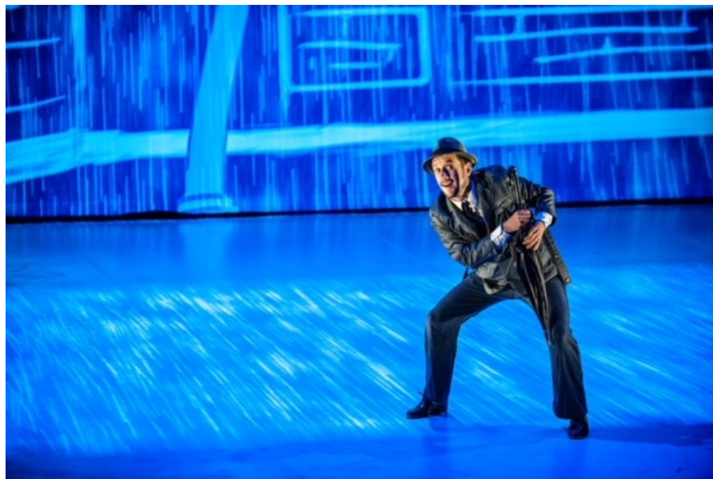
No dance, no paradise