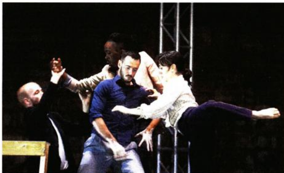
"Kokoro" progovara o različitostima

Odsjek plesa Akademije dramske umjetnosti u Zagrebu mjesto je na kojem se od 2013. godine prvi puta u Hrvatskoj može studirati ples. U sklopu predmeta "Repertoarna radio-