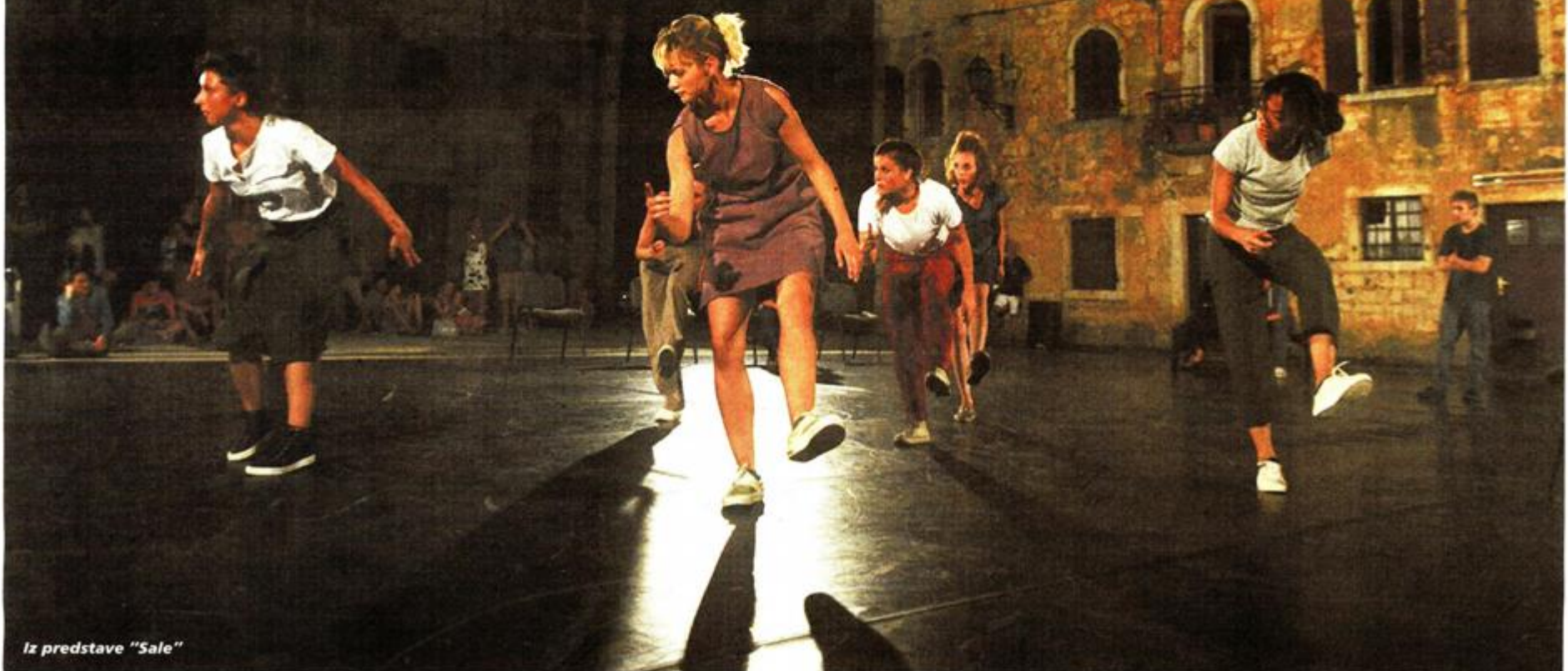
Iz predstave "Sale"