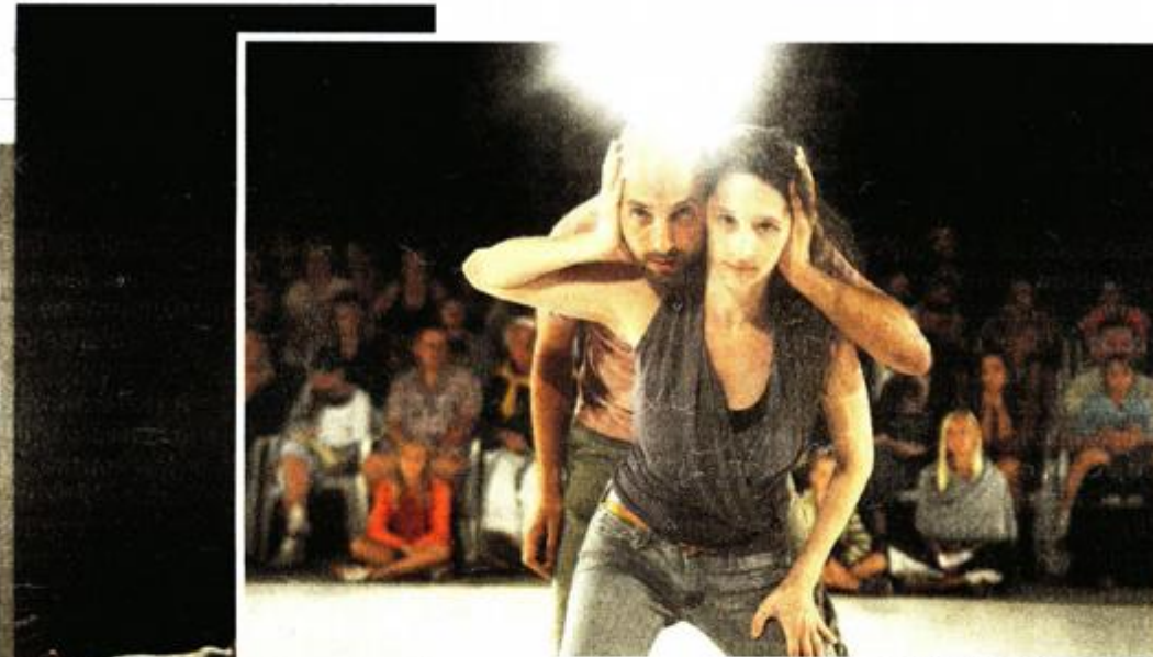
Predstava "Point Of You" propituje zašto moramo uvijek biti u pravu