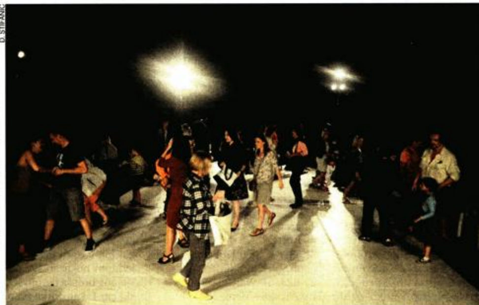
I publika je postala aktivan sudionik "Point Of You"