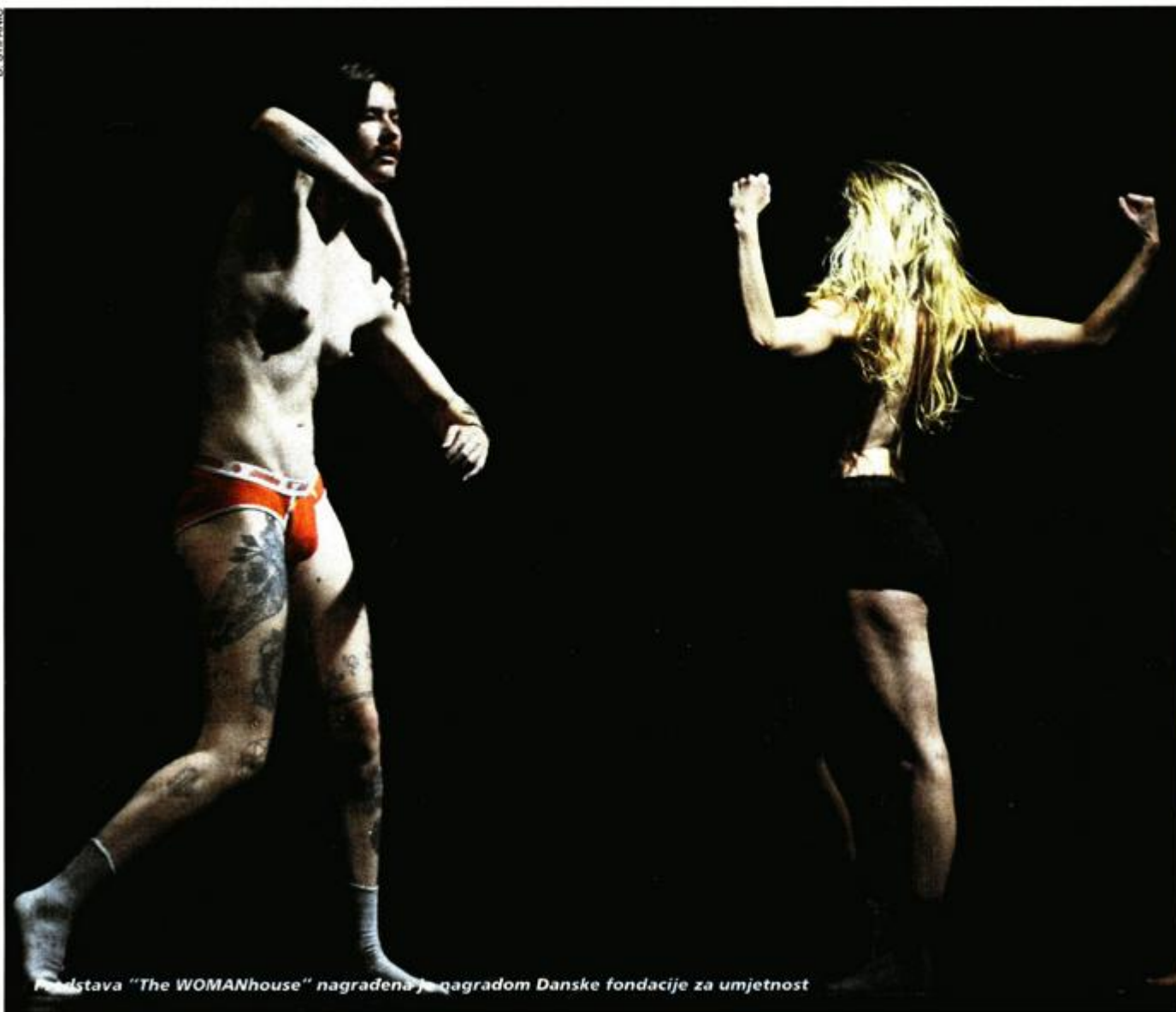
predstava "The WOMAnhouse" nagrađena je nagradom Danske fondacije za umjetnost