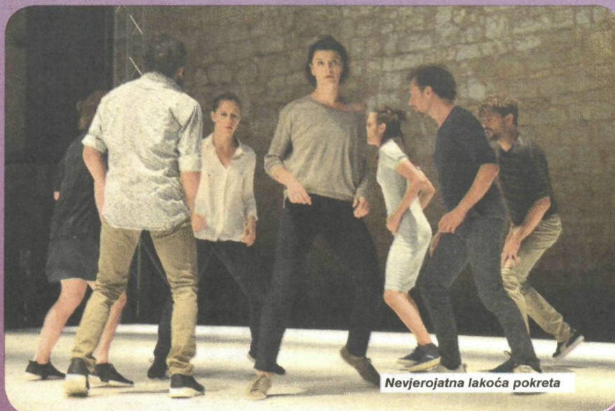
Nevjerojatna lakoća pokreta

Publike je na svim festivalskim večerima bilo uglavnom puno, a ljudi su dolazili iz raznih krajeva.