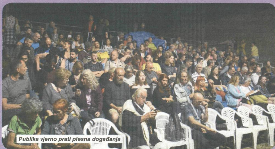
Publika vjerno prati plesna događanja