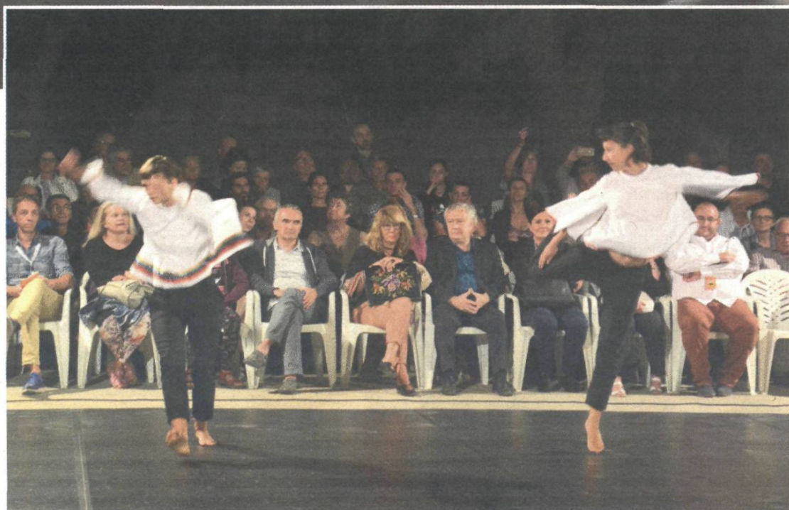
Hrvatska predstava u koreografiji Rajka Pavlića "Poskočite anđeli"